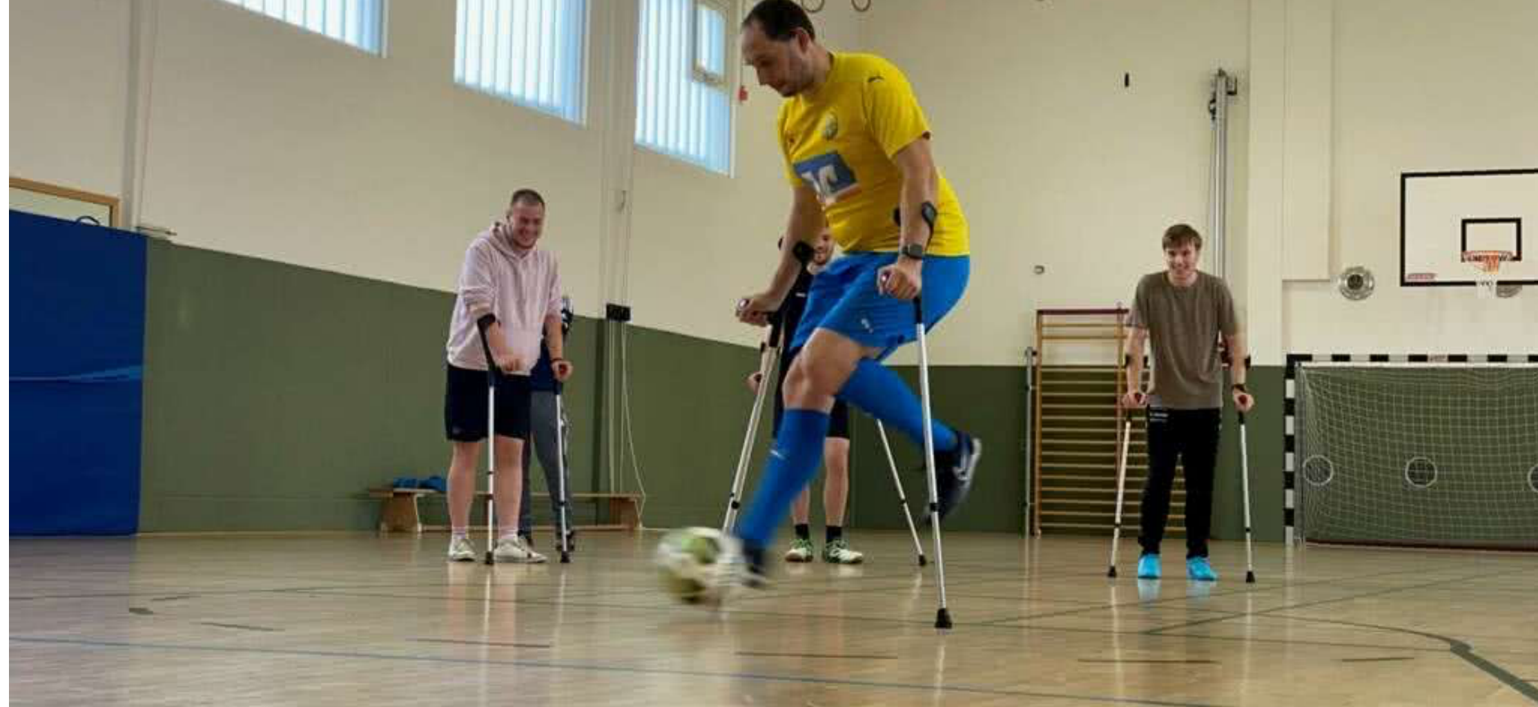
Rollentausch: Die Fortbildungs-Teilnehmerinnen und -Teilnehmer probierten sich auf Gehhilfen aus.